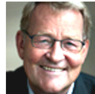
Niels Helveg Petersen